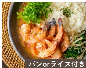
パンorライス付き ガーリックシュリンプ Garlic Shrimp ¥1800