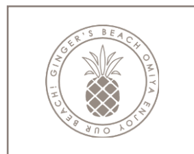
週替わりランチ Weekly Lunch スタッフにお尋ねください ¥1300～