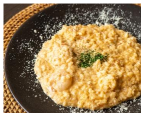
ラクサ風リゾット Laksa Style Risotto ¥1500