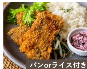
パンorライス付き 国産アジフライ 自家製しば漬けタルタルソース Fried Horse Mackerel ¥1300