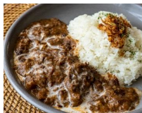
ハッシュドビーフ Hashed Beef ¥1500