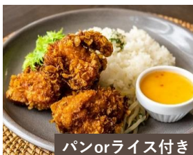
パンorライス付き クリスピーモチコチキン スイートチリマヨネーズ Crispy Mochiko Chicken ¥1300