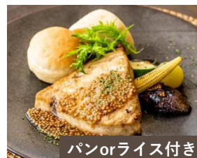
パンorライス付き カジキマグロのソテー ゴールデンマスタードソース Sautéed Swordfish ¥1800