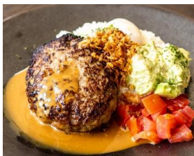
ロコモコ 温玉添え グレービーソース Loco-Moco ¥1500

ライス大盛り無料 パスタ大盛は+100円。すべて税込みです。 写真はイメージです。パンorライスはワンプレートのご提供です。