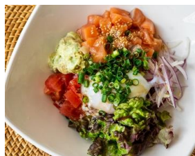
サーモンのポキボウル Salmon POKE Bowl ¥1800