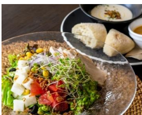
低温調理した鶏むね肉の サラダディッシュ Chicken Salad Dish ¥1500