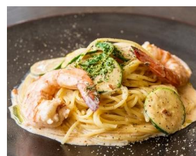
本日のパスタ Today's Pasta スタッフにお尋ねください ¥1300